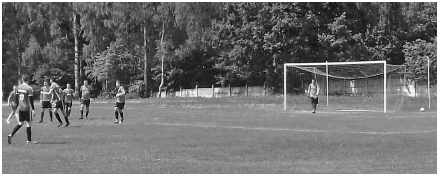
В конце апреля, перед началом нового игрового сезона, на стадионе установили новые сертифицированные футбольные ворота.

У стадиона и на стадионе появились новые ворота. Одни входные, двое – фут-