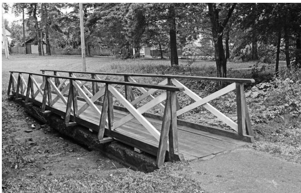
Новый деревянный мостик на «Тропе здоровья» по пути на стадион.