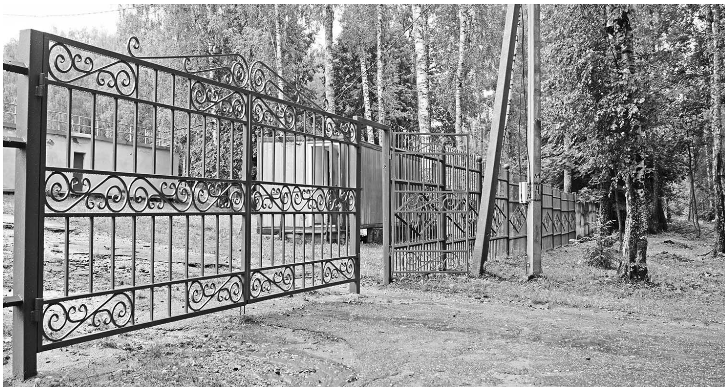
Старые входные ворота отправили «на пенсию», заменив на новые, а забор покрасили.