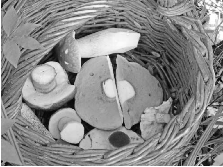
Еще пять раз по столько, и будет полная корзина.

После нескольких дождливых дней прошел слух, что появились грибы, те самые, которых называют настоящими или даже благородными. До того иногда попадались то сыроежки, то лисички. Но все ждали грибов трубчатых — боровиков, а также их близких родственников.